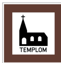
20/a/1. ábra "